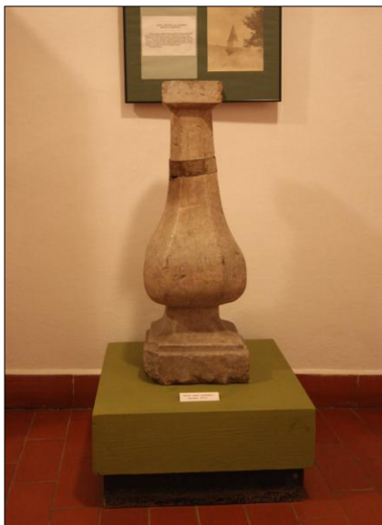
zdjęcie nr 8. Oryginalne zwieńczenie Wieży Ariańskiej.

Kamień węgielny znajdujący się na szczycie Wieży Ariańskiej miał symbolizować najwyższego. Był interpretowany jako znak Boskości lub jako znak szatana. Piramida znajduje się na „Pieczęci Iluminatów”, która została umieszczona m.in. na amerykańskim dolarze, gdzie szczyt piramidy stanowi „Wszystkowidzące Oko” oprawione w masoński trójkąt. Oryginalne zwieńczenie wieży przechowywane jest obecnie w Muzeum Regionalnym w Krasnymstawie.